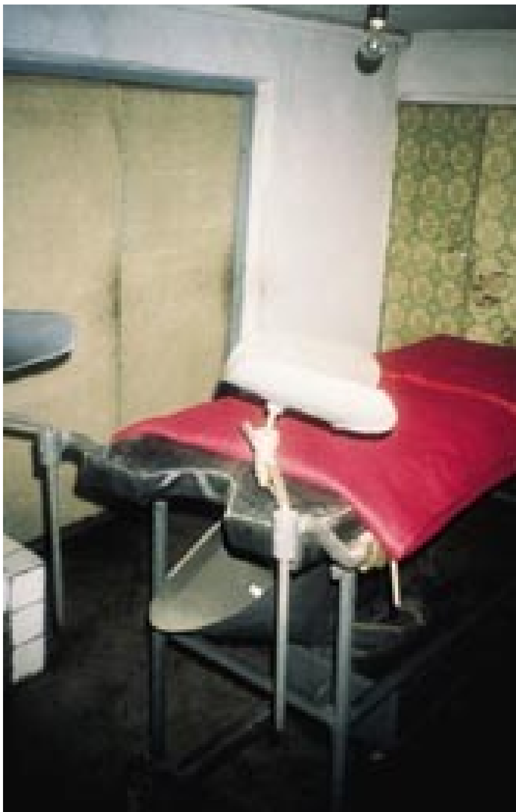
Fødestuen på Dongsan ri-hospital