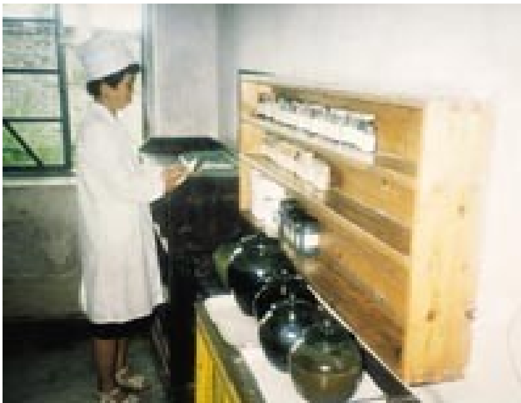
Tradisjonelle medisiner på krukker og glass i apoteket på Jisin ri-clinic

Min guide var lege i det nordkoreanske helsetilsynet. Han hadde ansvaret for utvikling av primærhelsetjenesten. Etter hvert som vi ble bedre kjent, hadde vi lange diskusjoner om deres husstandslegesystem. De var stolte av sitt primærlegekorps, men hadde klart sett behov for en kvalitetsutvikling de neste årene. Deres leger hadde også en altfor stor arbeidsmengde. Hver arbeidsdag skulle legene både utføre ca. 20 konsultasjoner fra morgenen av og så bruke ettermiddagene til hjemmebesøk med vekt på forebyggende helseoppgaver. Legene samlet også flere familier på kveldene for å gi helseopplæring. De siste fem år med betydelig medisinmangel var alle leger blitt pålagt å samle sammen 20 kg med medisinske urter for produksjon av tradisjonell medisin. Å samle slike urter kunne ta opptil seks uker for hver lege.