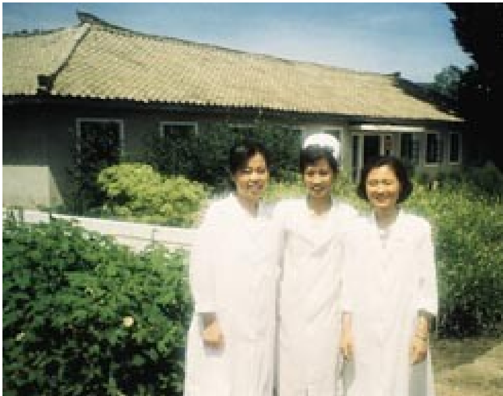
Farmasøyt, lege og jordmor foran urtehagen til Jangsuwon ri-clinic.

Før avreise prøvde jeg å finne relevante opplysninger om Nord-Korea, men tilgjengelig informasjon var svært begrenset. Jeg vil derfor gi en kort beskrivelse av det "lukkede landet". Det bor ca. 22 millioner mennesker i Nord-Korea på et areal tilsvarende 1/3 av Norge. Mesteparten av landet består av fjell. Det dyrkbare arealet utgjør ca. 15 %. Selv i gode vekstår kan landets jordbruk kun dekke 80 % av matbehovet. I årene 1993 – 94 ble Nord-Korea rammet av flere sammenfallende kriser. Varehandelen med Russland stoppet helt opp. Samtidig opplevde landet flere naturkatastrofer (både flom og tørke). I løpet av kort tid stanset nesten all tungindustri, og det oppstod akutt matmangel. All produksjon av medisiner og medisinsk utstyr har også opphørt. Fra 1995 har FN hatt et omfattende hjelpeprogram i landet, med vekt på matvarer og barns helse og utdanning.