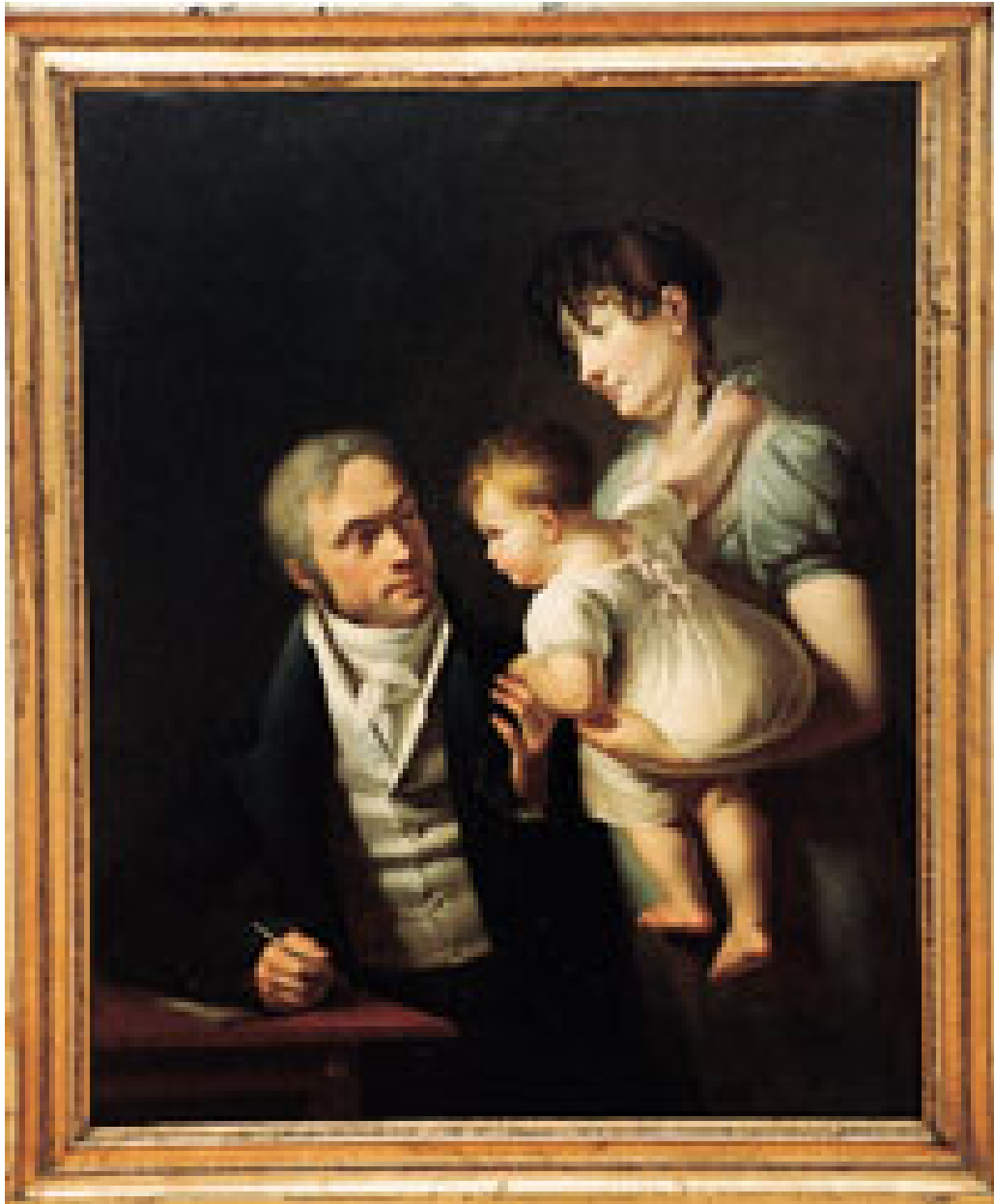
Figur 2 En legefamilie i 1809, et bilde på borgerlighet

verd mer penger enn lerretet, og der problemene med å gjenkjenne den avbildede ikke skyldes symbolikken, men kunstnerens ferdigheter.