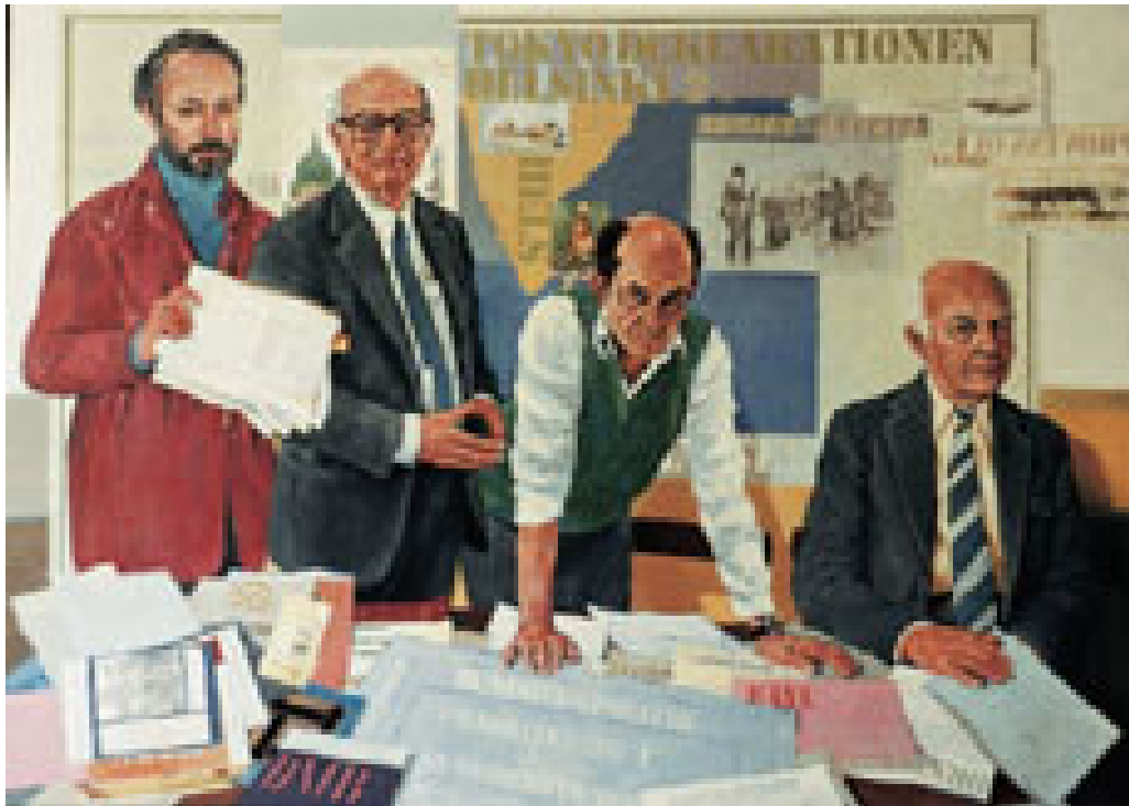
Figur 4 Dansk gruppeportrett med fart og liv