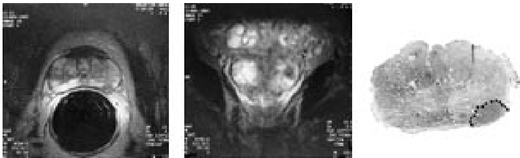
Figur 5 a) Et aksialt og b) koronalt endorektalt MR-bilde av prostata viser en liten tumor på venstre side hvor man mente at det ikke forelå kapselgjennomvekst. c) Den histopatologiske undersøkelsen av operasjonspreparatet viste et relativt stort gjennombrudd (3 mm)