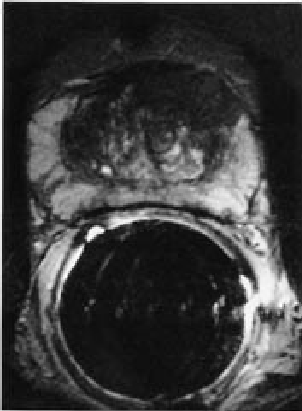
Figur 3 Aksialt endorektalt MR-bilde (T2-vektet) viser hypointens tumor fortil på venstre side (pil) hos pasient med forhøyet s-PSA-verdi. Biopsi gav diagnosen karsinom. Primært var flere runder med sekstantbiopsier negative