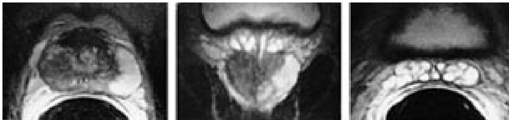
Figur 2 a) Aksialt endorektalt MR-bilde (T2-vektet) av prostata viser hypointens tumor i den perifere sone på høyre side. Normal perifer sone på venstre side med høy signalintensitet. b) Koronalt endorektalt MR-bilde (T2-vektet) av prostata og proksimale deler av sædblærene hos samme pasient. Normale væskefylte sædblærer kranialt for prostata. c) Aksialt endorektalt MR-bilde (T2-vektet) viser normale sædblærer med hypointense vegger og hyperintense væskefylte lumina

Fremstilling og differensiering av ulike typer normalt og patologisk vev i prostata krever bruk av både T1- og T2-vektede bilder. I en oversiktsartikkel av Schiebler og medarbeidere i Radiology i 1993 (11) er det en detaljert beskrivelse av de ulike signalmønstrene; noen av de viktigste er vist i tabell 2. Et T1-vektet bilde vil vise prostatakjertelen og sædblæren som homogene strukturer med intermediaer og lav signalintensitet. Et T2-vektet bilde vil differensiere mellom den perifere sone (høy signalintensitet) og overgangssonen (lav signalintensitet) og vise svært høy signalintensitet i de væskefylte tubulære hulrommene i sædblærene (fig 2).