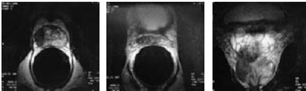
Figur 6 a, b) To aksiale endorektale MR-bilder og c) et koronalt endorektalt MR-bilde viser en tumor med både kapselgjennomvekst og innvekst i sædblærene. Dette ble bekreftet ved den histopatologiske undersøkelsen av operasjonspreparatet

Innvekst i sædblærene viser seg i T2-vektede bilder som fortykkelse av de hypointense veggene og utfylling av hulrommene i sædblærene med hypointenst tumorvev (fig 6). Væsken i sædblærene er normalt sterkt hyperintens. Dette gir en optimal bakgrunn for fremstilling av tumorvekst i sædblærene. Dilatasjon av sædblærene på grunn av obstruerende infiltrasjon av tumor i ductuli ejaculatorii kan også påvises.