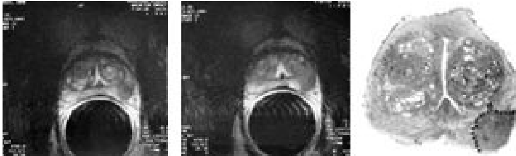
Figur 4 a, b) To aksiale endorektale MR-bilder av prostata med en tumor i den perifere sone på venstre side hvor man mente at det forelå kapselgjennomvekst. c) Dette ble avkreftet ved den histopatologiske undersøkelsen av operasjonspreparatet

(stranding) i det periprostatisk fettvev er upålitelige for prediksjon av kapselgjennomvekst (18). Irregulær konturdeformitet, tumorvev i den rektoprostatisk vinkel og asymmetri av de nevrovaskulære buntene ved prostatas laterale hjørner er sannsynligvis de beste kriteriene (tab 3). En stor andel av disse svulstene viser kun spredning av mikroskopiske tumorfoci (< 1 mm) til det ekstraprostatisk vevet ved den histopatologiske undersøkelsen av operasjonspreparatet; 43 % i vår studie (19). Ingen radiologisk metode har høy nok oppløselighet til å påvise en slik form av spredning.