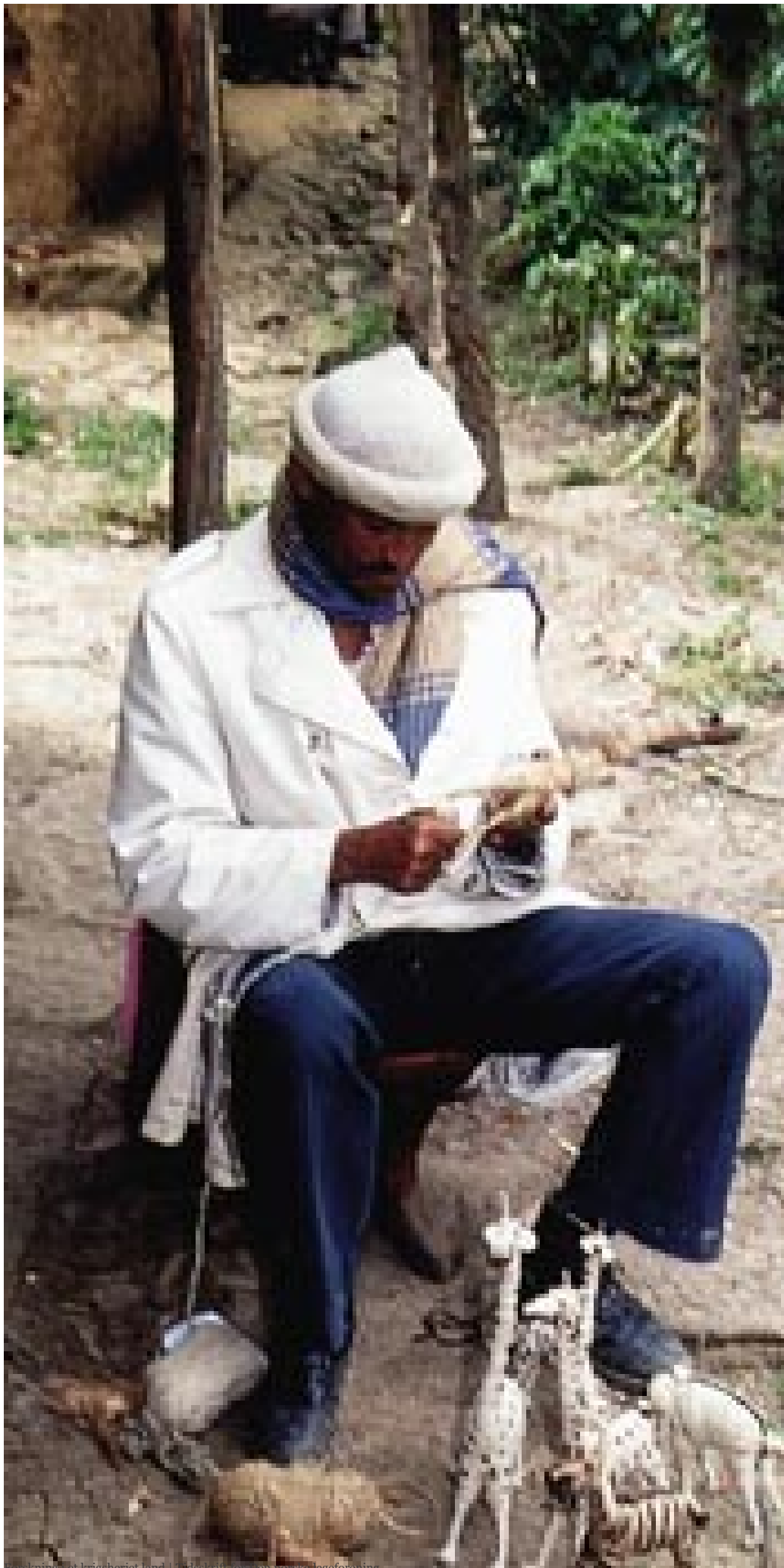
Fotokning i et krigsherjet land | Utskikkelse for Den norske legeforening