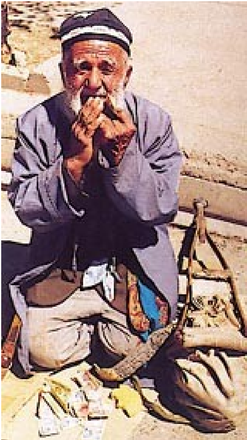
Små pensjoner og manglende sosialt sikkerhetsnett gjør at tigging blir eneste utvei for mange