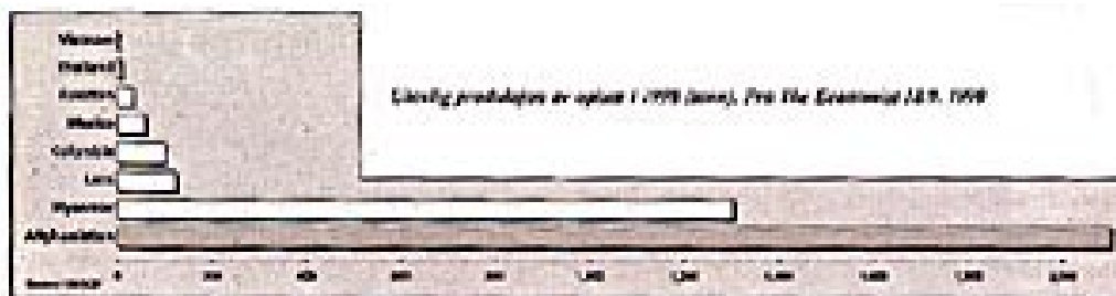
Ulovlig produksjon av opium i 1998 (tonn). Fra The Economist 18.9. 1999