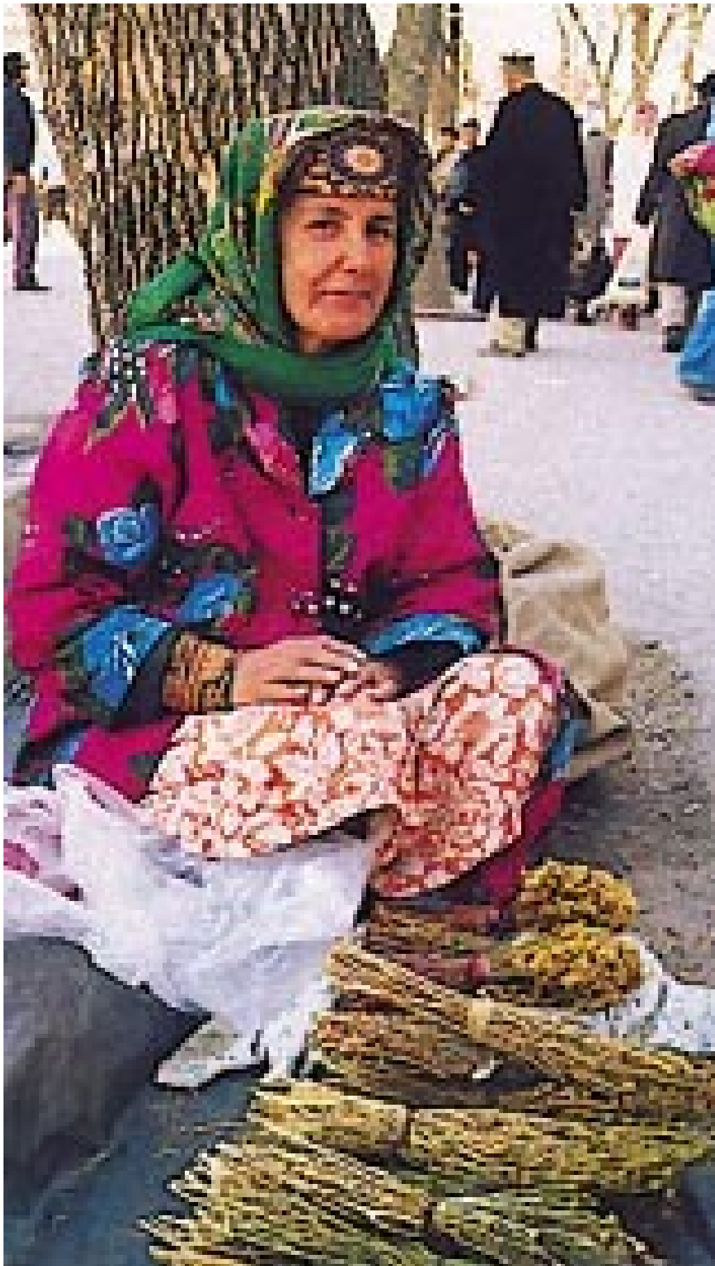
En kvinne selger helbredende urter på gaten. Tadsjikistan har en stor rikdom av slike urter, og helseministeriet oppmuntrer til bruk av dem