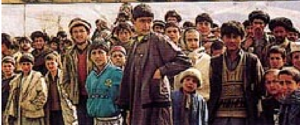
Landsbyene i Nord-Afghanistan klorer seg fast til fjellsiden. Nederst en del av de mange nysgjerrige fremmøtte afghanerne.