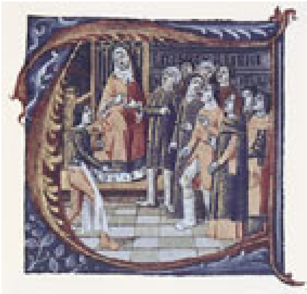
Galen ser på en pasient med sykdom i underekstremitetene (17)