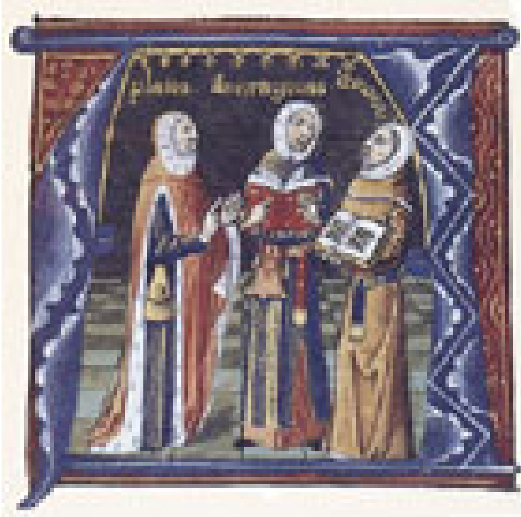
De tre filosofer Platon, Anaximander og Demokrit (17)

I verket Symposium skrev Platon (427 – 347 f.Kr.) at skjønnheten utgjør rammen om alt det mennesket skaper, frembringer og produserer (poiesis). I Metafysikken beskrev han det fundamentale skillet mellom det Skjønne og det Gode. Poiesis er i snever betydning den spesielle form for kulturskapende virksomhet som er «diktning» – det at noe diktes frem gjennom et symbolbærende budskap. I 10. bok i Staten erklærte Platon at kunsten bare er en etterligning (mimesis) av den sanselig-materielle virkelighet.