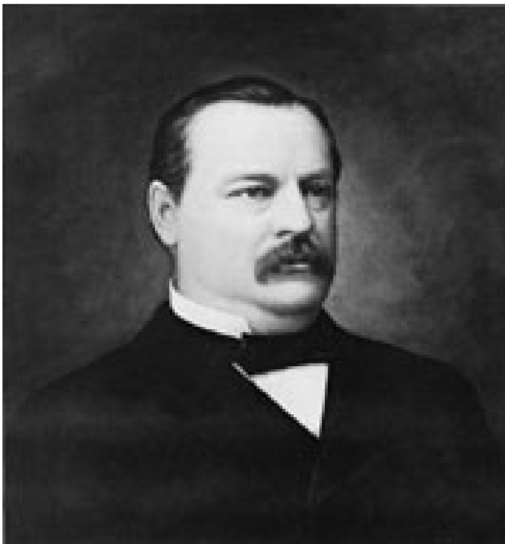
Grover Cleveland (1837 – 1908), som var president i USA i to perioder, iverksatte i 1893 en dekkoperasjon for å hemmeligholde en kreftsykdom han ble operert for (19)

Grover Cleveland (1837 – 1908) var president i to perioder (1885 – 89) og (1893 – 97). I 1893 fikk han en kreftsvulst i munnen. For at dette skulle hemmeligholdes ble han operert på en privat yacht mens den seilte ned Long Island Sound. Nyheten ble imidlertid kjent og offentliggjort i pressen. Presidentens stab benektet konsekvent at det var en kreftsvulst og sa at det var en vanlig tannekstraksjon (10).