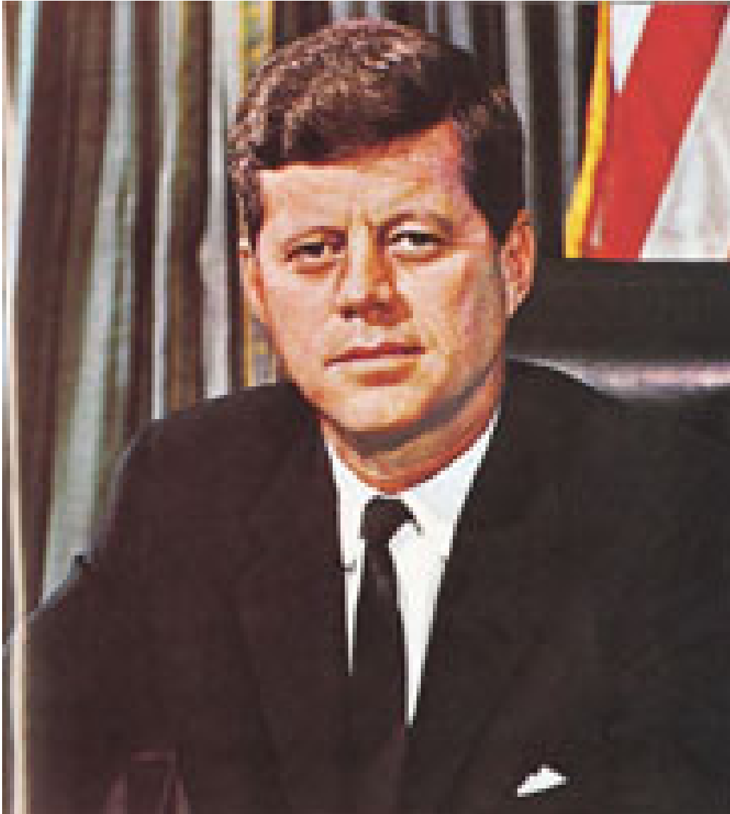
President John F. Kennedy (1917 – 63) fremstod utad som vital og frisk, men hadde alvorlige helseproblemer som ble holdt skjult (19)

1917 – 63)). I tillegg har det vært fem attentatforsøk (7). For det tredje har amerikanske medier en sterk tradisjon for pågåenhet og åpenhet om personlige forhold overfor offentlige personer, ikke minst politikere. Fysisk og psykisk helse er blant de temaer som er gjenstand for stor oppmerksomhet både for de kandidater som deltar i valgkampen og i særdeleshet for den som blir valgt og dermed blir sittende i embetet.