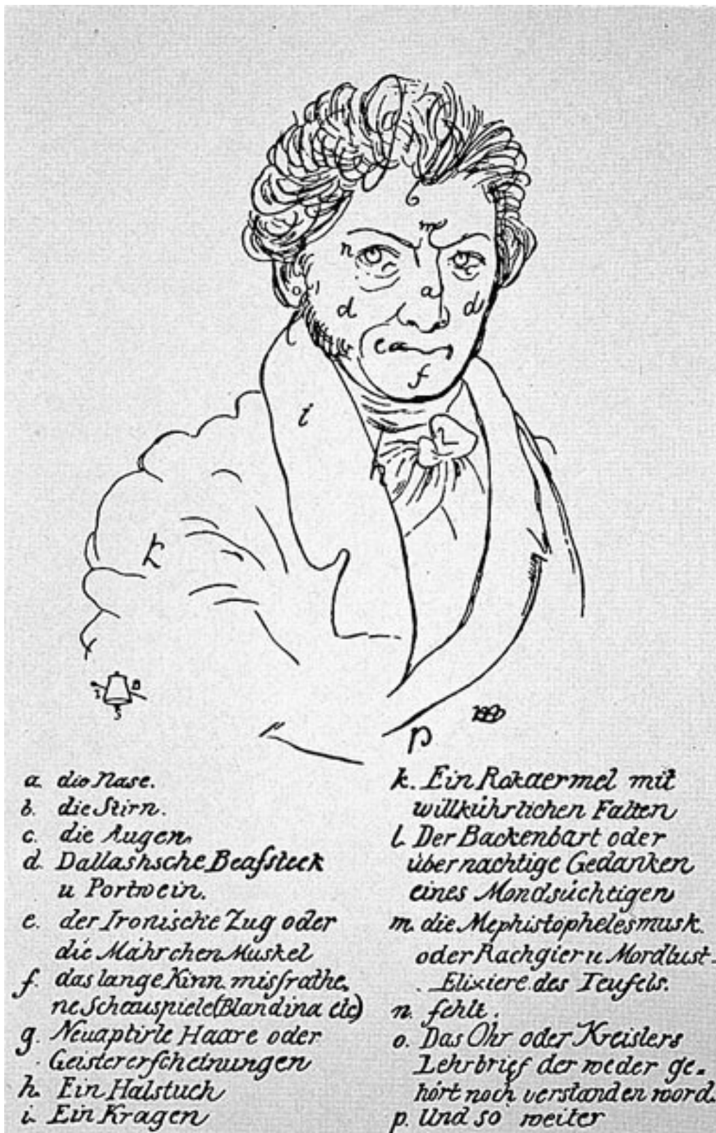
Figur 1 Selvportrett av E.T.A. Hoffmann (1776 – 1822). Hoffmann ironiserer bl.a. over sin samtids forkjærlighet for fysiognomi, altså å kunne lese personlighetsegenskaper ut av ansiktsform og -trekk

Romantikens intense og omfattende register av følsomhet fikk så vel Johan Wolfgang von Goethe (1749 – 1832) som Walter Scott (1771 – 1832) til å ta avstand fra den «sykelige» overspentheten de særlig fant hos Hoffmann. Men han ble både etterliknet og beundret. Hoffmanns nokså direkte påvirkning på den store russiske litteratur er verdt å merke seg. Nikolaj Gogols (1809 – 1852)