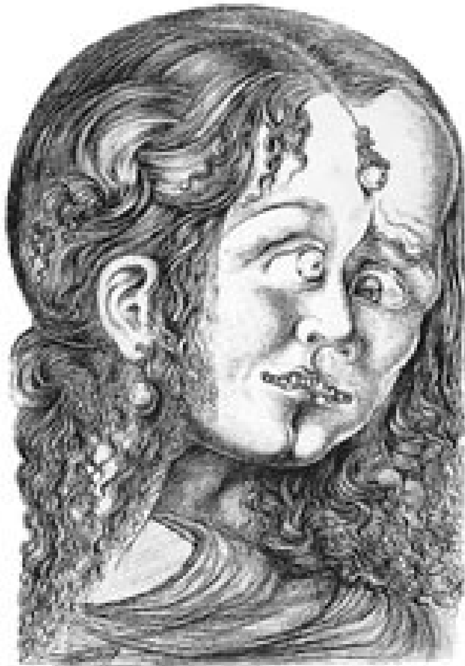
Figur 4 Salvador Dalí: Macbeth. Dalí har her grepet til en fremstilling som sees hos enkelte schizofrene, nemlig en oppsplitting av menneskeansiktet i atskilt profil og en face (18)

Dermatologen Gottfried Benn (1886 – 1956), en pioner innen tysk modernistisk lyrikk – for øvrig også erklært nazist – karakteriserte (omkring 1930) alle kunstner- og forfatterkolleger fra de foregående 50 år som en forsamling «psykopater, alkoholikere, vagabonder, fattighuslemmer, abnorme, nevrotikere og degenererte». Og om verket var dubiøst – hva så med dets opphavsmann? Bohemens anstøtelige og iøynefallende livsførsel var velkjent og for så vidt bevis og bekreftelse god nok. Enkelte patografer nevner,