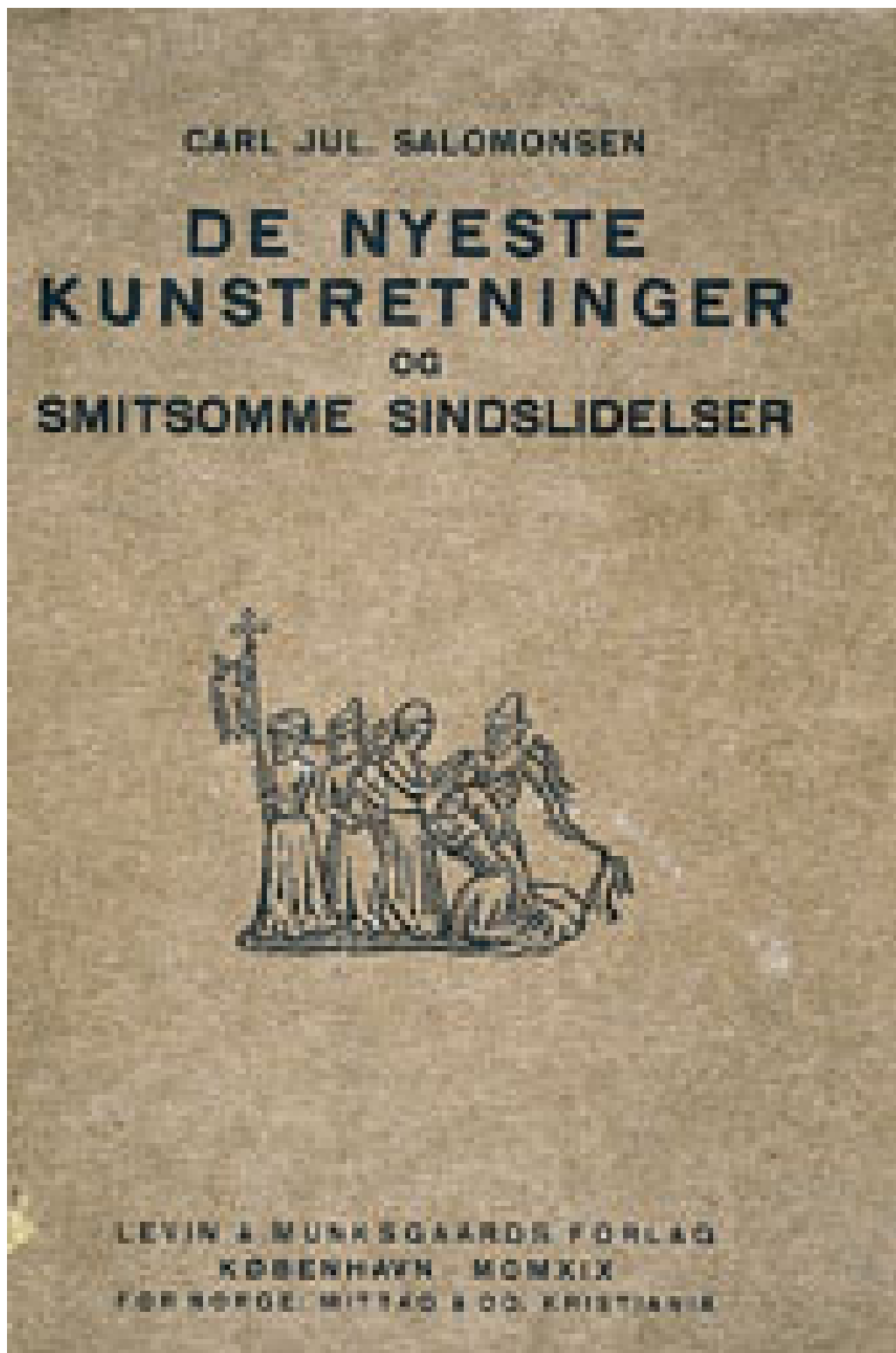
Figur 2 Selve boktittelen med undertittel antyder hva forfatteren egentlig har til overs for sin samtids kunst (16)