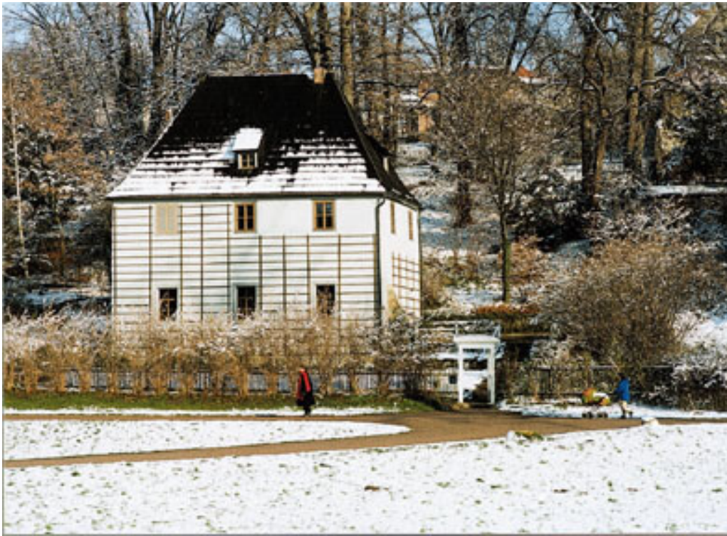
Goethes käraste tillflyktsort «Das Gartenhaus» i Ilmparken i Weimar har rekonstruerats under kulturhuvudstadsåret

Med all sannolikhet bidrog dessa kontakter till att hos Goethe skapa en grund för det stora intresse för naturvetenskaperna som han senare i livet kom att utveckla. Inom det medicinska området gjorde han till och med en egen insats då han 1784 beskrev förekomsten, även hos människa, av ett mellankäkben (os intermaxillare). En kritisk och på vetenskap grundad inställning till samtidens läkekonst kom också att prägla hans beskrivning av sina egna sjukdomar och deras behandling.