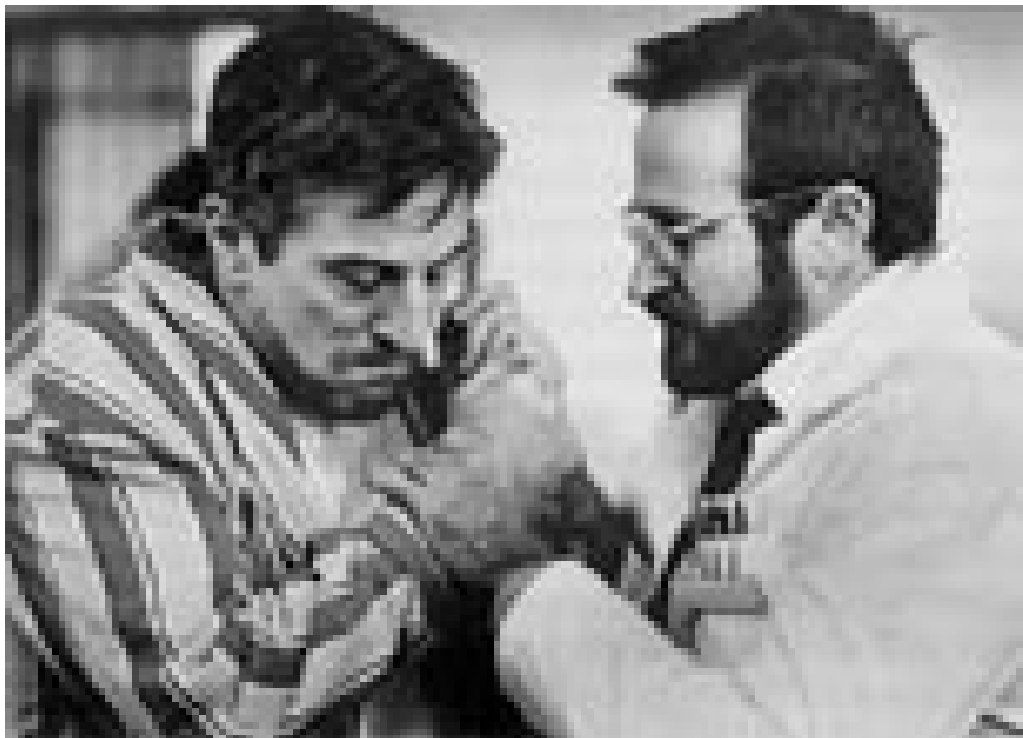
Fra filmen Oppvåkningen

Boken viser hvordan medisins vekst og fall avspeiler seg gjennom spillefilmer i siste halvdel av det 20. århundret. Her er mange spennende historier, men på bakgrunn av de store forventningene som tittelen skaper, blir det hele likevel litt skuffende. Det skyldes dels den særdeles amerikanske innfallsvinkelen og dels den deskriptive og til tider litt kjedelige formen. Men du verden så mange detaljer og så mye informasjon for alle som er interessert i legerollens utvikling – både på og utenfor lerretet.