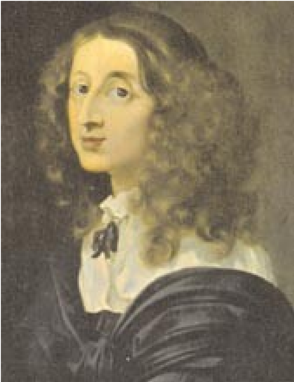
Dronning Christina (1626 – 89)

Den lesende lege kan av og til oppleve overraskelser. Svenskene vant trettiårskrigen for protestantene i Europa. Seierherrens datter, Christina av Sverige (1626 – 1689), abdiserte, konverterte til katolisismen og flyttet til Roma. En større politisk skandale har vi ikke hatt i vår verdensdel i dette årtusen. Det er skrevet hyllemeter om årsaken til dette: Manglende evne til å regjere, sterk religiøs katolsk vekkelse, homoseksualitet – og endelig Hollywoods versjon med Greta Garbos forelskelse i en utenlandsk diplomat. Ingen av årsakene er helt troverdige. Stor blir overraskelsen når vi leser hennes beretning om sin fødsel i utkastet til selvbiografi: ”Jag föddes med segerhufva, var helt luden och hade en grof och stark rost, hwilket alt inbillade