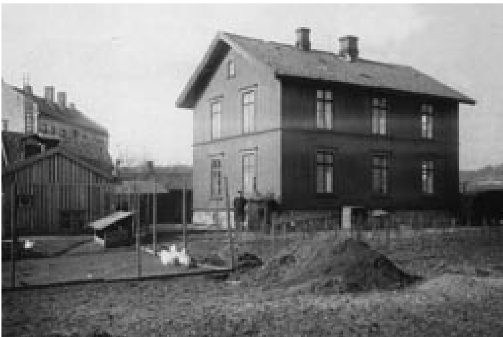
Figur 4 Epidemisykehus i Maridalsveien i Oslo (10)