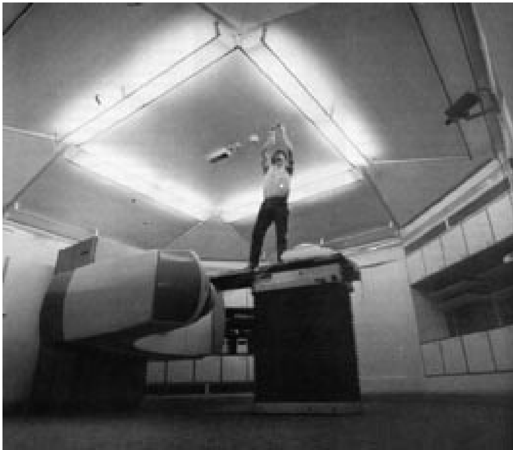
Figur 5 Strålebunkeren, Ullevål sykehus i Oslo.