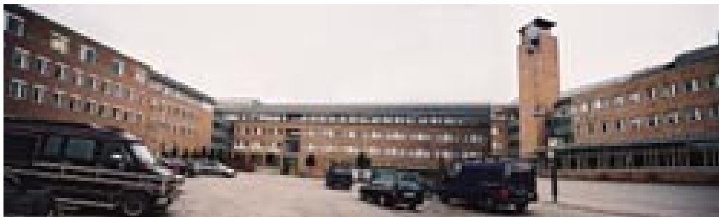
Figur 10 Fløyene strekker (fang)armene ut mot deg når du ankommer Rikshospitalet i Oslo. Foto Ø. Larsen 2000