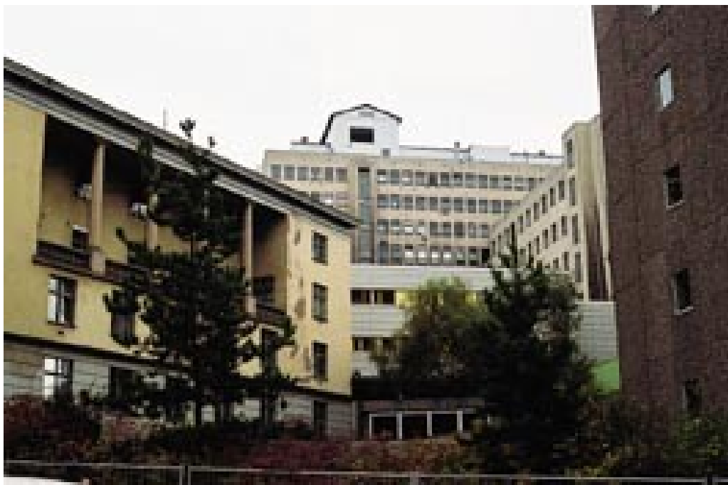
Figur 15 Det gamle Rikshospitalet sett fra Holbergs gate. Foto Ø. Larsen 2000