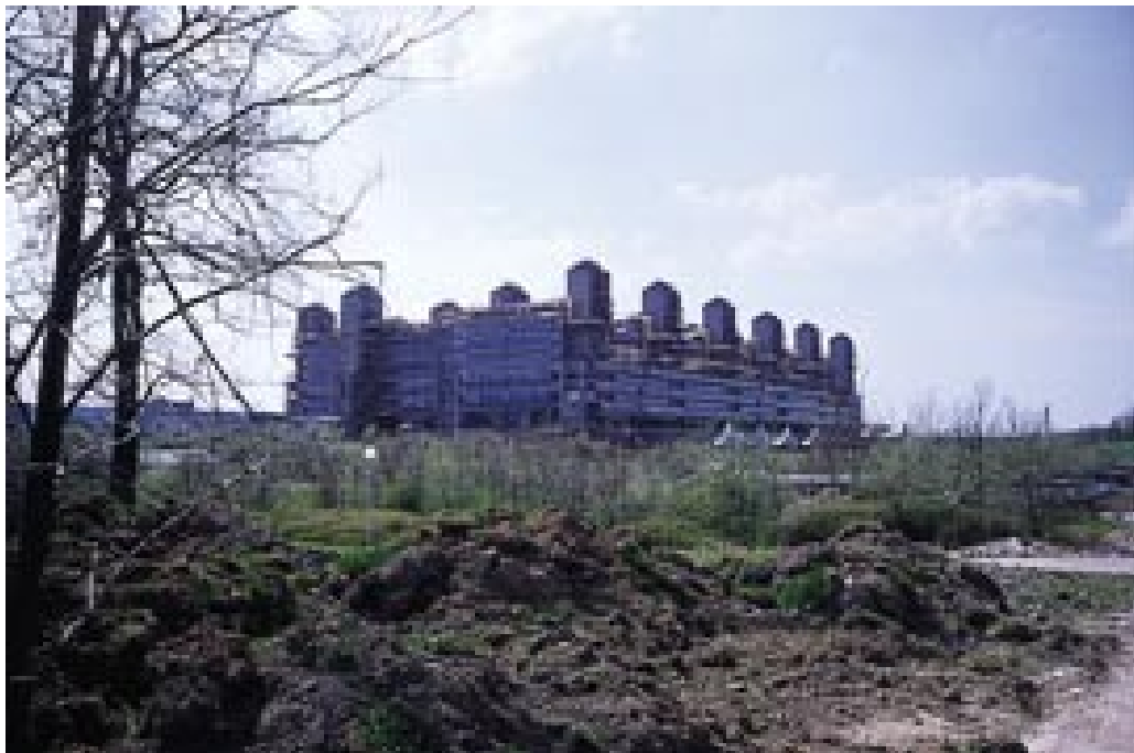
Figur 14 Klinikum Aachen, Tyskland.

Midt på bildet ser vi den påbygde plastikkirurgiske fløyen fra slutten av 1980-årene. Om den var ment å skulle likne en boreplattform, vites ikke. I alle fall signaliserer den at her har vi viktigere ting å beskjeftige oss med enn å tenke på hva som er pent. Kanskje kan en slik holdning virke betryggende på pasientene. Men neppe når det gjelder nettopp en plastikkirurgisk avdeling.