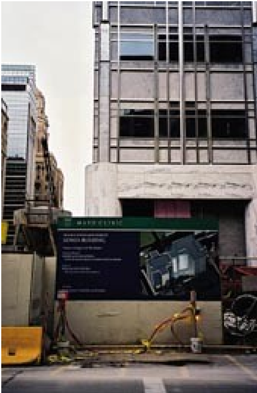
Figur 13 Mayo Clinic, Rochester, MN.