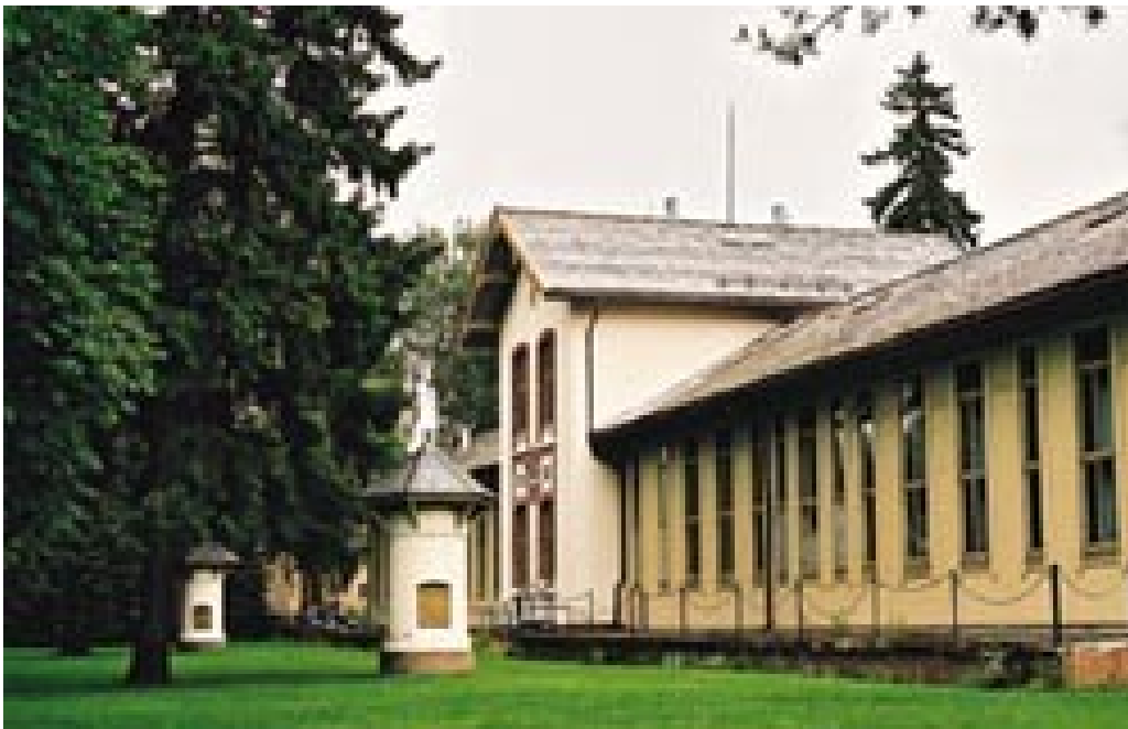
Figur 8 Epidemipaviljong med ventilasjonstårn, Ullevål sykehus, Oslo. Fra friskluftinntak i tårnene gikk kanaler inn til sykesalene med utlufting over tak.