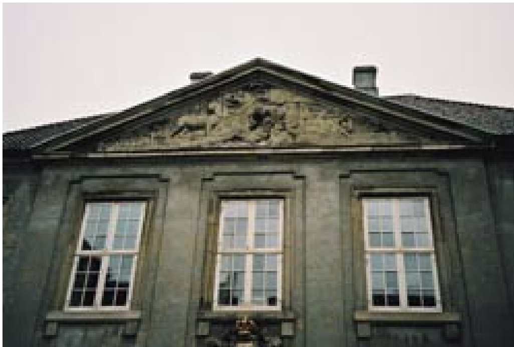
Figur 1 Gavl, Det Kongelige Frederiks Hospital, København.

Det er prinsipielt de samme tolkingsproblemene for hvilken som helst type arkitektoniske arbeider. Om sykehusbygg finnes det en omfattende litteratur, her vist til kun et lite utvalg (2 – 5), men det kulturhistoriske perspektivet trer ofte i bakgrunnen.