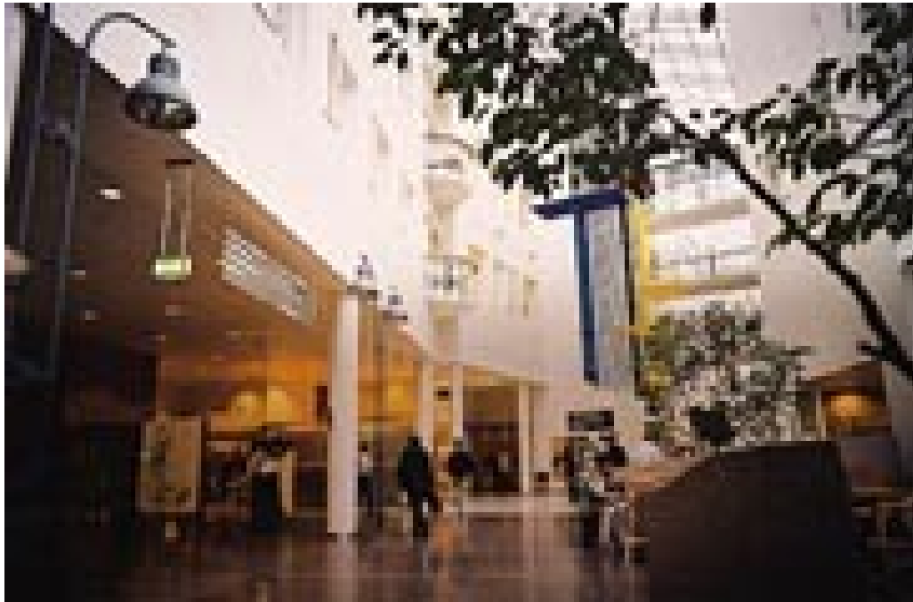
Figur 11 Hovedkorridor med Syden-konnotasjoner ved det nye Rikshospitalet i Oslo. Foto Ø. Larsen 2000

Et av vår tids mer ekstreme sykehus, arkitektonisk sett, er Klinikum i Aachen i Tyskland. Rundt 1980 stod det her ferdig et enormt byggverk ute på landet utenfor byen. Det er rør og kanaler alle vegne. På avstand ser det ut som en forvokst middelalderborg. Når man kommer nærmere, går assosiasjonene mer i retning av oljeraffineri (fig 14). Men innenfor er det 1 400 pasientsenger og arbeid for 3 800 ansatte og et tilsvarende antall studenter! Likheten med Pompidou-senteret i Paris er slående. Skrekkelig, vil noen si. Artig påfunn, vil andre mene. Gad vite hvordan den kulturhistoriske tolkingen av arkitekturen vil bli om noen år.