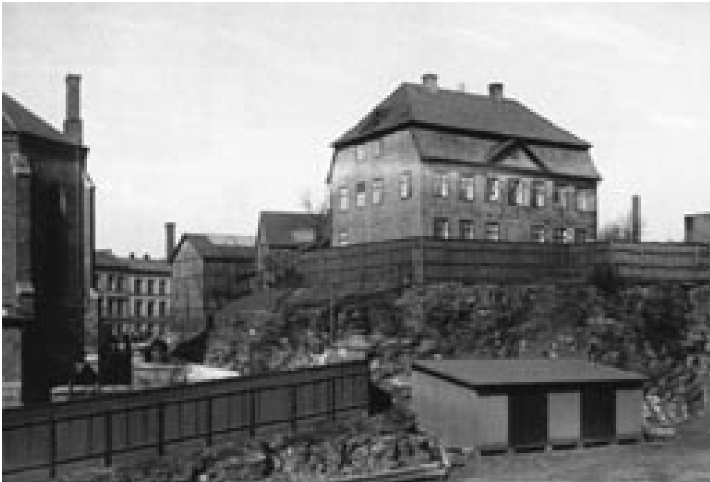
Figur 3 Sorgenfri, sykeavdeling for menn med veneriske sykdommer og delirium, fotografert i 1883 (10)