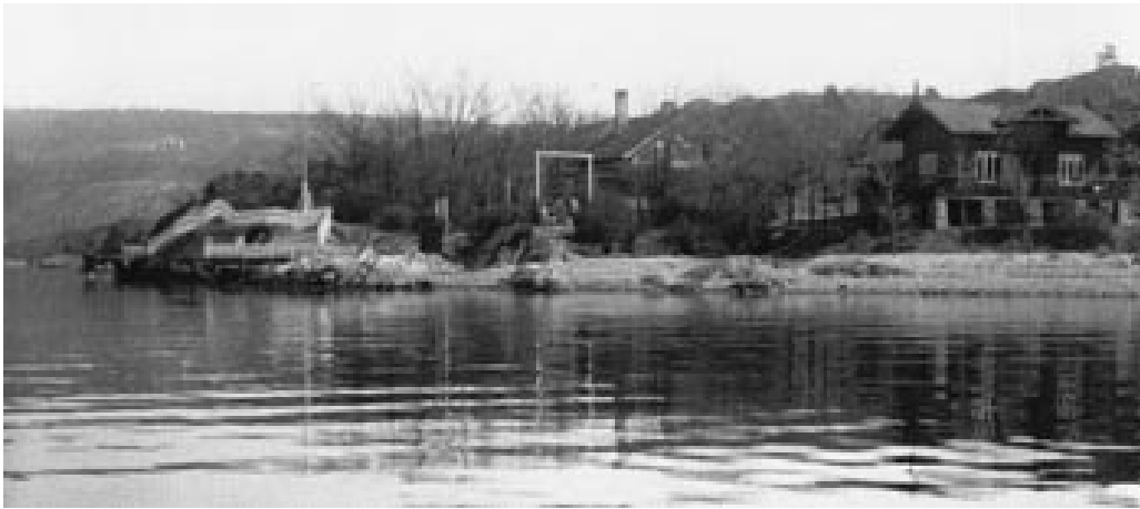
Figur 7 Barneavdelingen for tuberkuløse på Bleikøya i Oslofjorden. Foto fra 1885 (10)