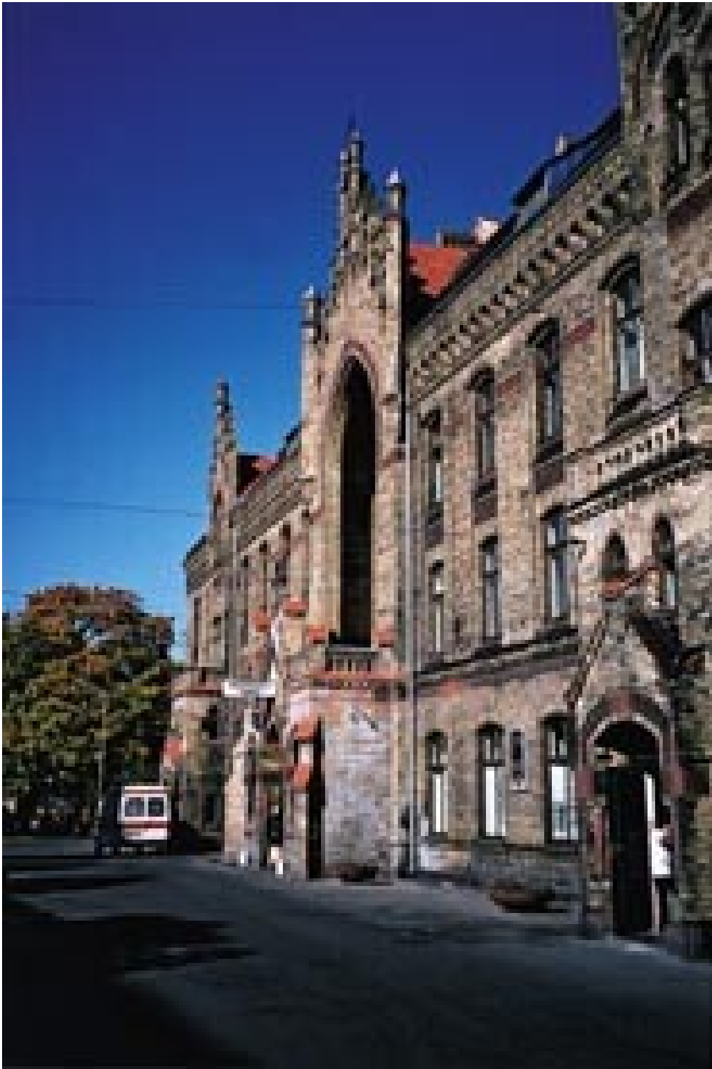
Figur 12 Det tidligere "Sykehus nr. 1" i Riga, nå akuttmottak (Emergency care hospital).