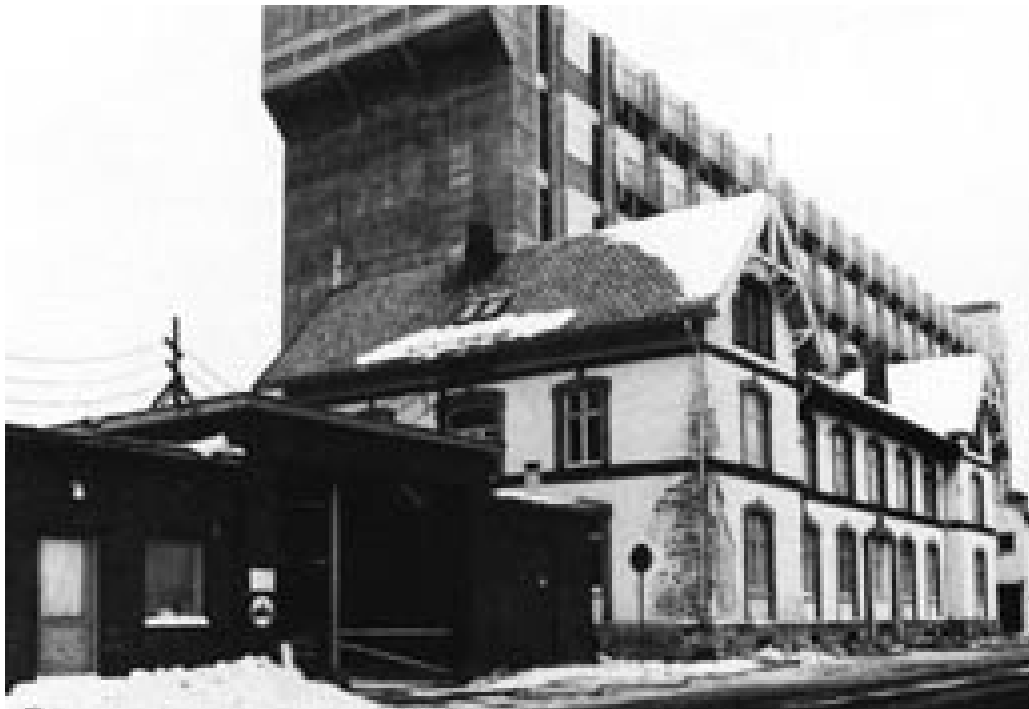
Figur 6 Ullevål sykehus, fra Thulstrups gates forlengelse – den gamle administrasjonsbygningen og det nye laboratoriebygget (10)