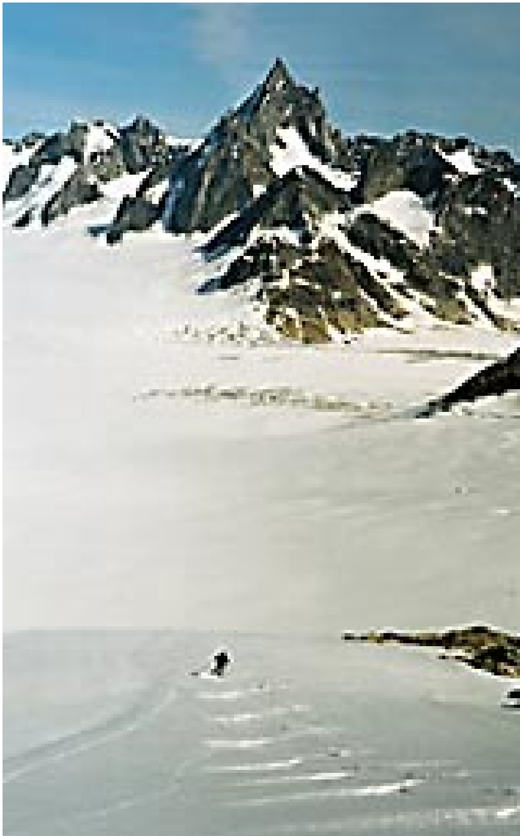
Vill og storslegen natur

Vi kan ikkje tolke eit samfunn ut frå kva problemstillingar legen arbeider med. I tillegg til å dekke viktige behov hos menneske med somatisk eller psykisk sjukdom, fungerer sjukehuset som ein nødhavn for menneske med sosiale problem, og ein stad for avlastning for heimebuande eldre som ikkje maktar å hente vatn og olje i dårleg vær. Trass i overveldande medisinske og sosiale inntrykk, oppfattar eg byen som eit godt fungerande samfunn, og dei aller fleste