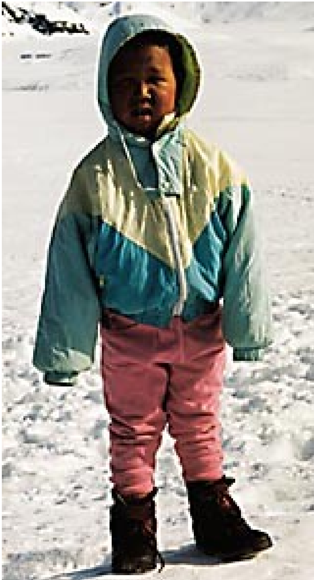
God og varm i moderne klede