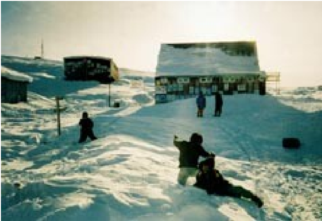
Glade barn i vintersol.

Dei første seks veker hadde eg 13 døgnvakter, med to sjølv-mord, tre forsøk på suicid, to "nestendrap", ein ekstra-uterin graviditet, tre pasientar med alvorleg blødning frå ulcus ventriculi, alvorlege astmaanfall, preeklampsi, neonatal icterus over grensa for utskiftingstransfusjon og nokre beinbrot. Eit sledefølgje gjekk gjennom fjordisen ei natt. Alle dei fem menneska og dei 12 hundane overlevde, og følgjet kjørte i fire timar fram til sjukehuset, etter at dei hadde kara seg i land. "Det blev noget koldt etterhvert, men vi hadde nok medbrakt til å varme oss," var den lakoniske kommentaren. Dei hadde sannsynlegvis varma godt opp før dei havna i sjøen. Einaste skaden fekk ein politimann med snøscooter som var ute for å berge dei; han braut foten og blei lagd inn.