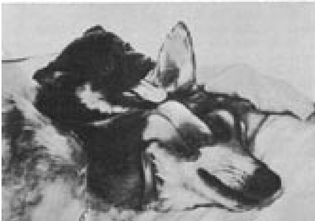
Figur 2 Fotografier i boken av reaksjoner hos de to hodene (2)