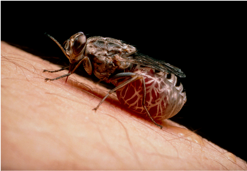
Figur 2 Tsetsefluge, Glossina morsitans .