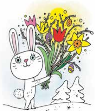
Illustrasjon: Kristin Roskifte

Riktige løsningsord publiseres i neste utgave av Nytt om legemidler og på legemiddelverket.no .