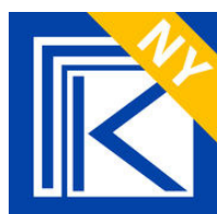
App til helsepersonell

Felleskatalogen har også utviklet en egen app til pasienter - Min Felleskatalog Pasient . Her kan pasienter lage sin egen medisinliste og søke opp pakningsvedlegg på alle registrerte legemidler. I tillegg får pasientene viktige varsel knyttet til sitt legemiddel fra Legemiddelverket.