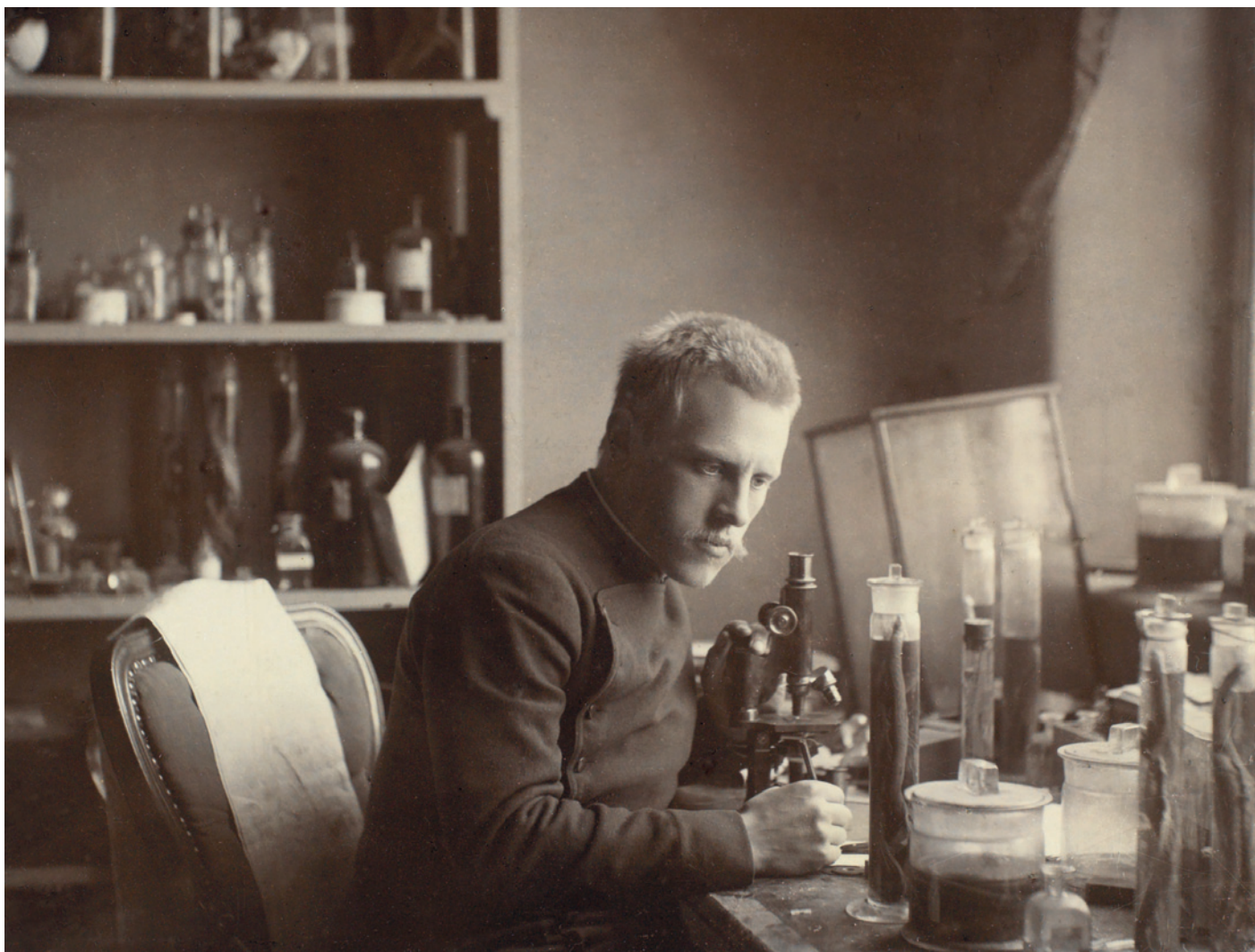
Fridtjof Nansen var først og fremst forsker. Her er han i sitt laboratorium ved Bergens Museum.

en stor forstand. Det var hemmeligheten ved hans hell. Det var forskjellen på ham og de mange virkningsløse menneskevenner som så gjerne vil omfavne verden, men nærer motvilje mot forstanden.»