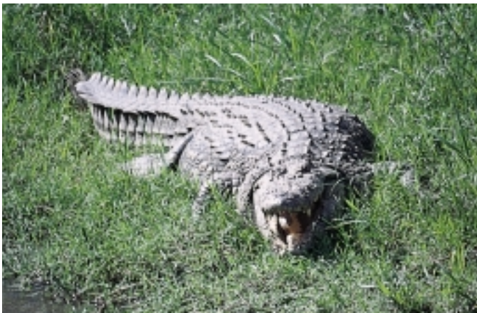
Figur 8 Stol aldri på en trekvart tonns nilkrokodille som smiler.