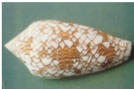
Figur 2 Conus textile , disse vakre og livsfarlige sneglene, kan man få lyst til å ta opp når man snorkler (fra Gopalakrishnakone (3))

nakensnegler adopterer nesleceller fra nesledyr de har spist, og neslecellene transporteres da til sneglenes overflate.