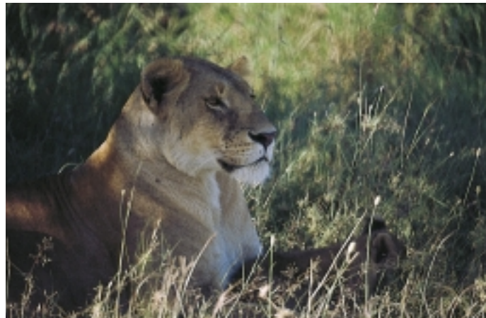
Figur 9 Løvinne.

lindres ved at området holdes nede i vann som er så varmt som pasienten kan tåle, på grensen til det som gir brannskader, ca. 45 °C (2). Prosedyren må gjerne gjentas flere ganger. Piggskater kan skade mennesker om de blir fisket. Stikk av fiskepigget er sjelden dødelig.